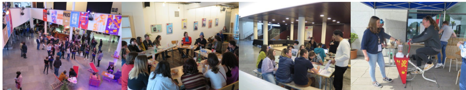
Le Festival, c'est des spectacles et des expériences pour les jeunes : un café des métiers du spectacle (comédiens, metteurs en scène, scénographe, photographe, autrice & créatrice lumière), un comité de rédaction du journal éphémère « la Pépète », un stand vélo-smoothies, des stands jeux de société, des cafés-philos...