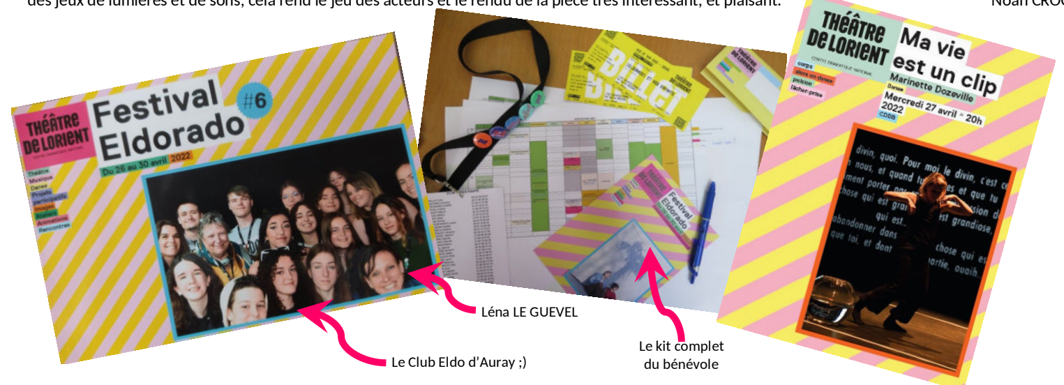
Léna LE GUEVEL