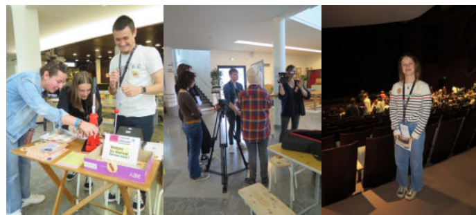
Nos élèves ont endossé avec beaucoup d'enthousiasme et de sérieux leurs différentes missions : créateurs de badges à destinations des festivaliers, reportages vidéo, placeurs, formation à la photographie par Aglaé BORY pour les illustrations de « La Pépète », animation des bords de scène...